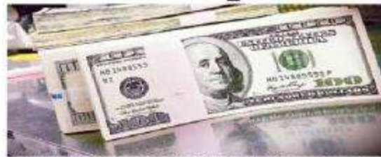
El organismo internacional advirtió acerca de los riesgos que

Ese crecimiento de la deuda puede ser bueno porque estimula inversiones y crece, advierte el FMI.