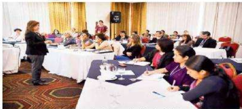
Las mujeres fueron capacitadas sobre la importancia de la electricidad.

La realización de este proyecto fue dada a conocer ayer duran-