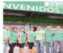
La tienda de Samayac generará 64 empleos, entre directos e indirectos.