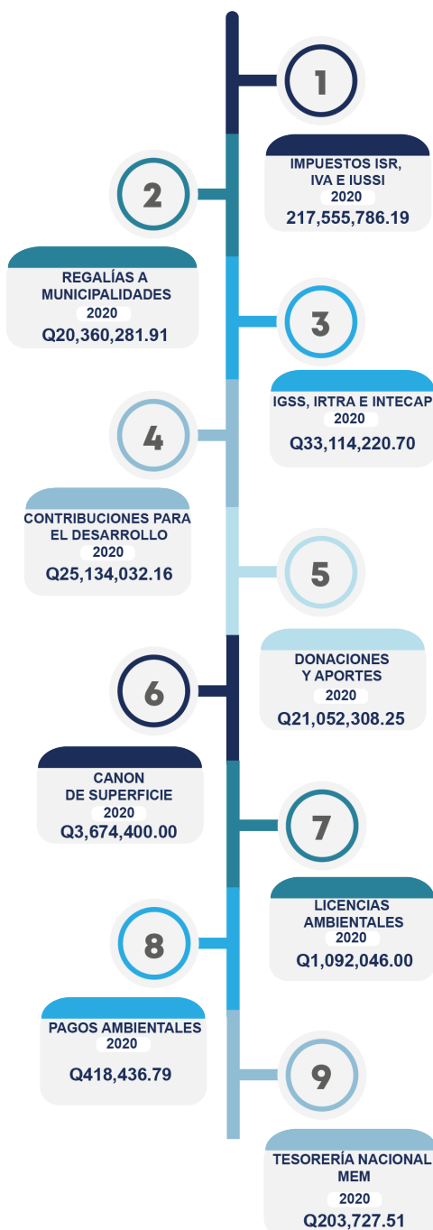
FIGURA 5 RESUMEN GENERAL DE PAGOS DE LA INDUSTRIA MINERA, AÑO 2020