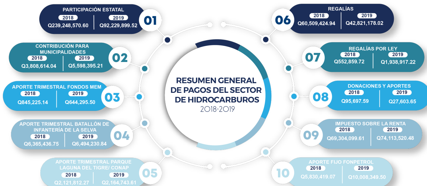
RESUMEN GENERAL DE PAGOS DEL SECTOR HIDROCARBUROS, AÑOS 2018 Y 2019